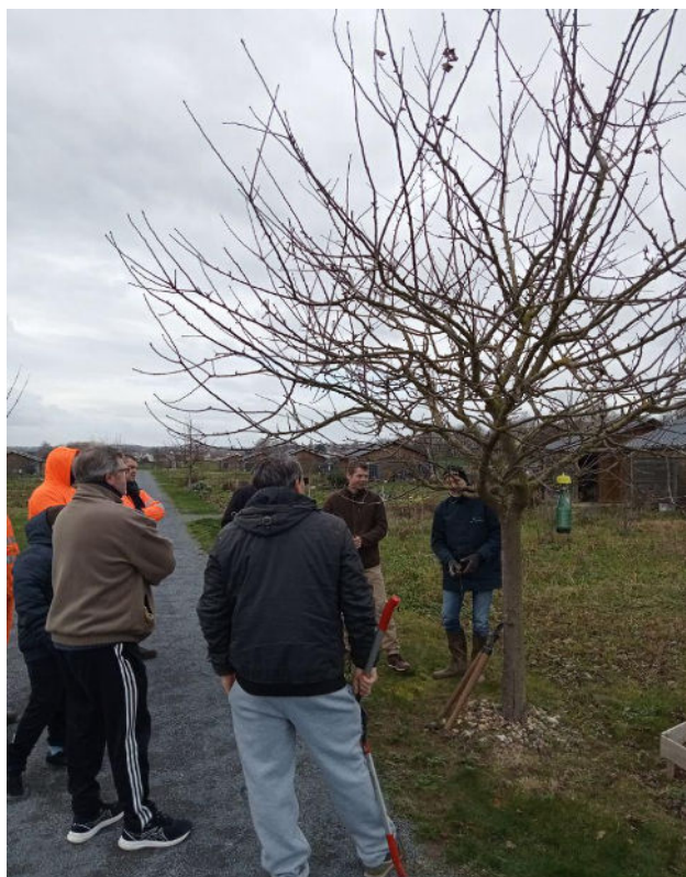
Avant la taille