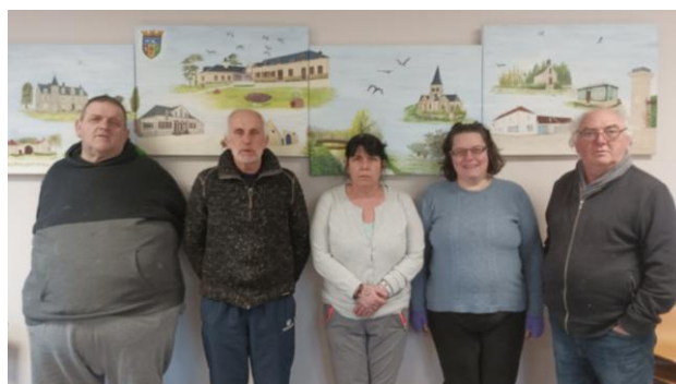
Les membres du Conseil d'Administration 2023