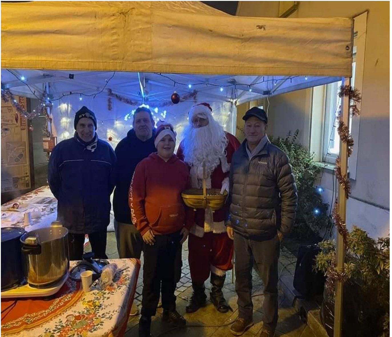
Photo réalisée dans le cadre de la soirée « chocolat chaud » offert aux enfants de la commune