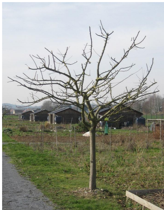
Après la taille