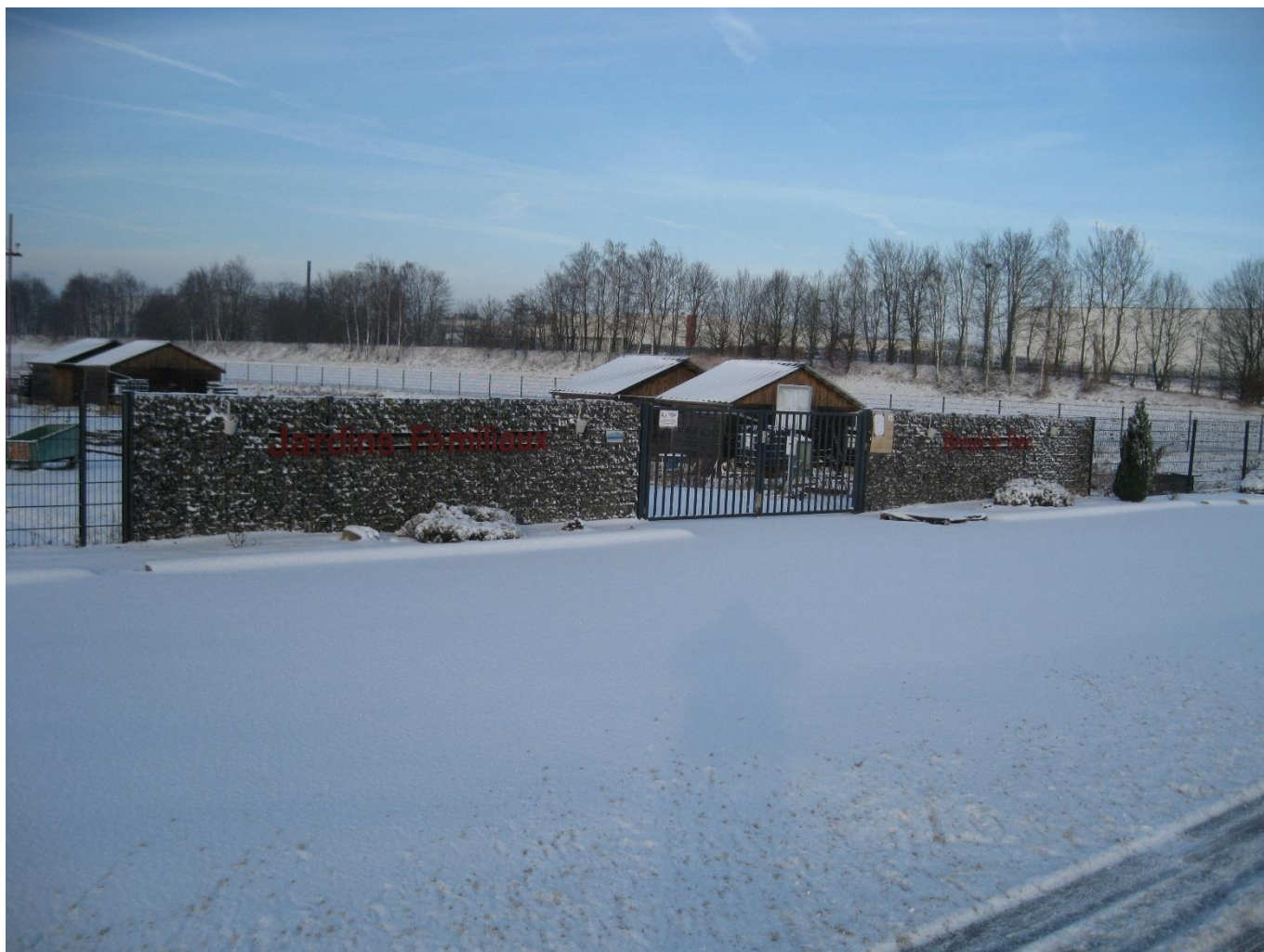
Les jardins familiaux de Breuil-Le-Sec sous la neige - Photo réalisée en janvier 2024