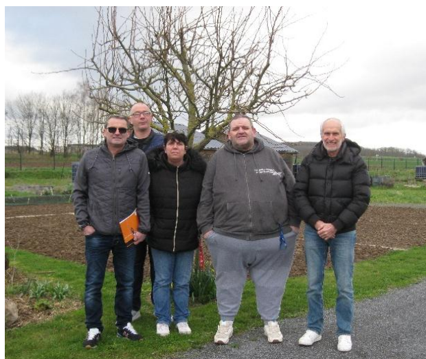
Les membres du Conseil d'Administration 2024